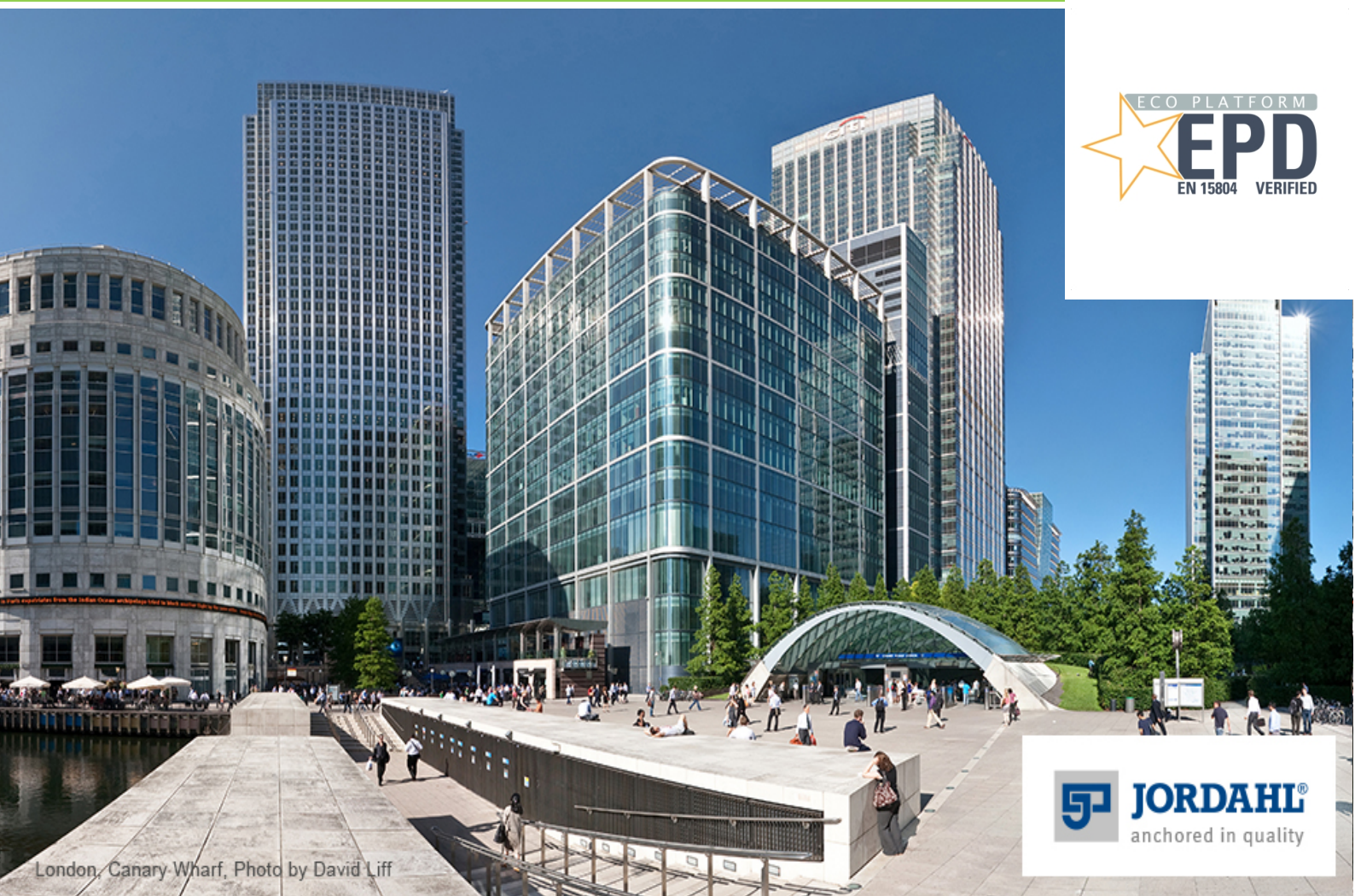
London, Canary Wharf