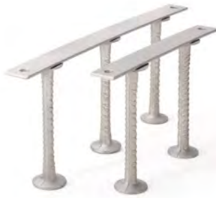
Abbildung 1: Durchstanz- bzw. Schubbewehrung JDA in gerippter Ausführung

JORDAHL Durchstanz- bzw. Schubbewehrungen werden bemessen nach: