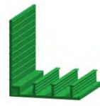
außenliegend DA 180/170 K