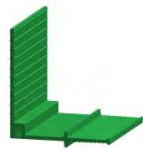
innenliegend D 180/170 K