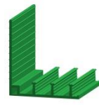
außenliegend DA 180/170 K