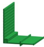
innenliegend D 180/170 K